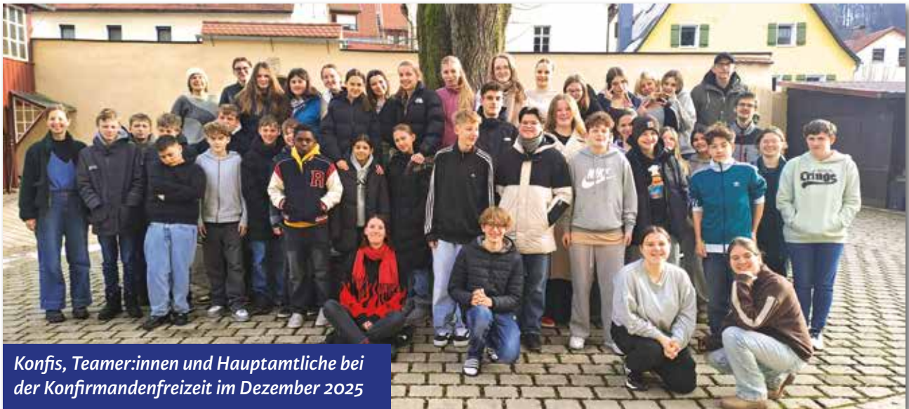
Konfis, Teamer:innen und Hauptamtliche bei der Konfirmandenfreizeit im Dezember 2025

SAMSTAG, 18. APRIL, 10 BIS 13 UHR, CHRISTUSKIRCHE