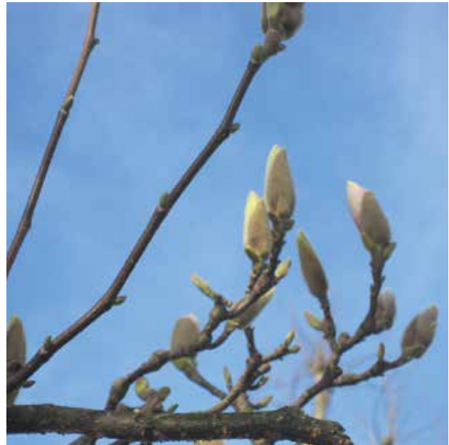
Egal, was die Welt gerade macht, der Frühling bricht sich Bahn